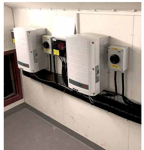
Växelriktare omvandlar likström till växelström.

Solcellerna på Solvarvsgatan 2-16 ska fungera som en testanläggning och om allt fungerar som det är tänkt ska även övriga fastigheter i beståndet tillverka egen el vad det lider.