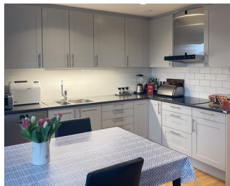
Katarinas härliga kök.

- Köket. Vi lagar mycket mat och älskar vårt stora fräscha kök. Sen längtar vi till våren så att vi kan fixa och använda vår balkong. Då vi är många i familjen uppskattar vi också extra mycket att vi har två badrum.