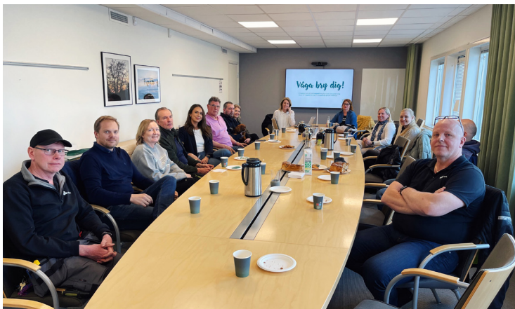
Utbildning hos Störningsjouren.

Läs mer om Våga bry dig på vår hemsida, www.amlovs.se/vaga-bry-dig eller på anslagen som finns i trapphus och tvättstuga.