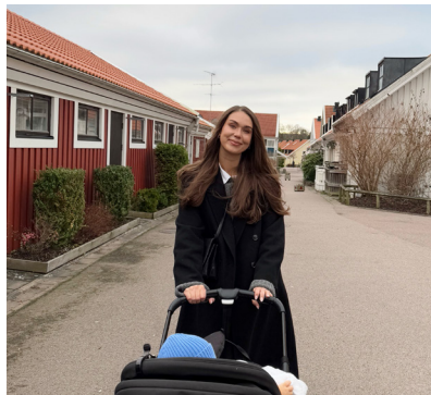
Annie tar tillvara på sista tiden som föräldraledig.