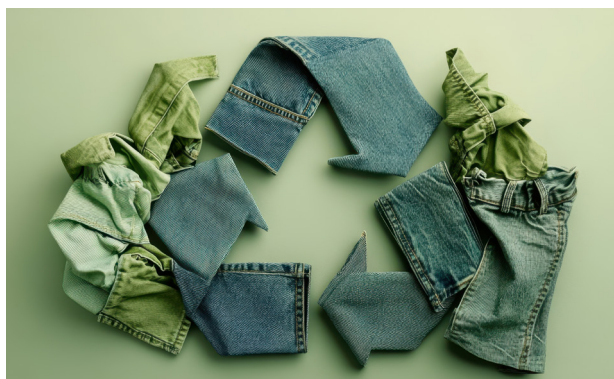
Tanken med den nya lagen är ökad återvinning.

Från och med årsskiftet gäller en ny lag för textilavfall i Sverige. Detta innebär att man inte längre får slänga textilavfall i sin vanliga soppåse. All textil så som kläder och hemtextilier behöver nu sorteras och lämnas i samlingsboxar som finns på en del av kommunens återvinningscentraler samt på vissa återvinningsstationer.