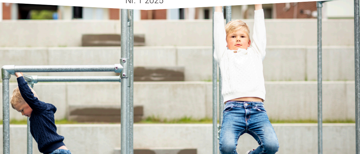
Lek på lekplatsen i Kortedala.