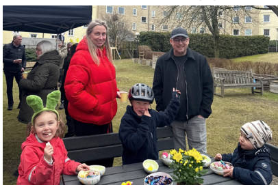
Påskäggen var populära.