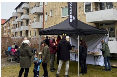
Mingel på innergården.