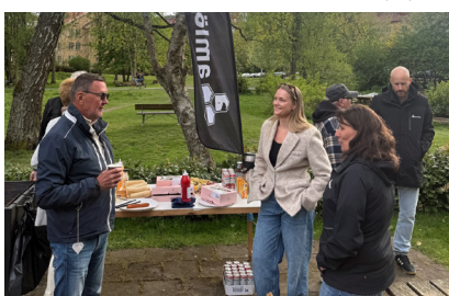
Härliga samtal grannar emellan.