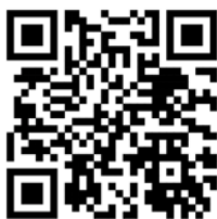
Skanna QR-koden för att hitta appen