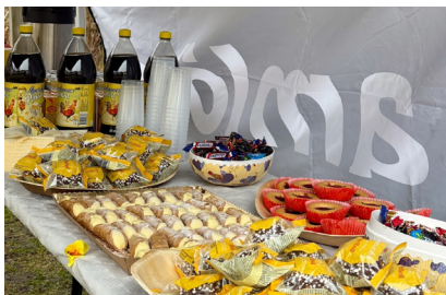
Massor av godsaker.

Strax innan påsk bjöd vi in våra hyresgäster i Lunden till påskfika på innergården Karlagatan 22/S:t Pauligatan 23-25. Det blev en trevlig eftermiddag med påskäggsjakt för barnen, fika och mingel grannar emellan. Tack till dig som kom!