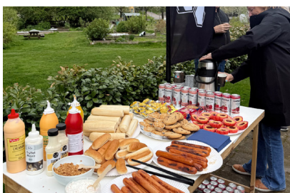
Gott med grillat.